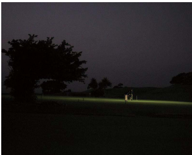
(沖縄 サザンクロスGC)

石川共販には楽しい思い出が一杯ある。沖縄ゴルフツアーもその一つだ。二泊三日で2ラウンドのゴルフプレーは勿論、二日続けて行った沖縄家庭料理の皿の数々、定番のソーキそば何度もお代りのオーダーをしまったアゲ豚のしゃぶしゃぶ等々、沖縄の魅力は語りつくせない。更には那覇国際通りの雑踏と、それと対照的な海の素晴らしさ、まるでハワイのような爽やかな風。早春の沖縄はベストシーズンである。写真は朝7時のスタートを待つサザンクロスGCの夜明け前のスナップ。思えば、これがハッピー3連休のスタートだった。